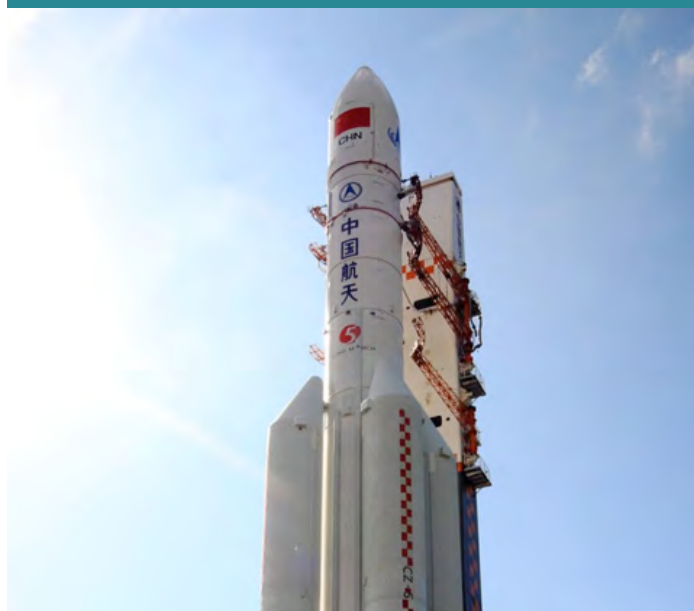
vettore Lunga Marcia 7 al Wenchang Space Centre

Il nuovo vettore Lunga Marcia 5 è stato lanciato lo scorso 3 novembre dal Wenchang Space Launch Center nella provincia di Hainan. Il nuovo vettore a due stadi è destinato alla messa in orbita di carichi elevati, con una capacità fino a 14 tonnellate nella Geostationary Transfer Orbit (GTO) e 25 tonnellate nella Low Earth Orbit (LEO) ed è il più grande dei lanciatori cinesi. Il lunga Marcia 5 utilizza due tipologie di combustibili, kerosene e ossigeno liquido che rendono il lancio meno costoso e inquinante. Questo lancio è il secondo effettuato dalla nuova base di Wenchang nell'isola di Hainan dopo quello dello scorso 25 giugno del vettore di media grandezza Lunga Marcia 7. Il vettore ha messo in orbita geostazionaria il satellite Shijian-17 che condurrà esperimenti sull'utilizzo della propulsione ionica.